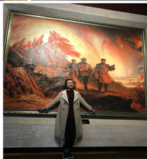
国培学员照金留影